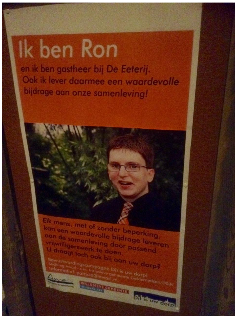
Poster van Ron voor de Bewustwordingscampagne

haar leven met beperkingen. Zij gaat met onze hulp deelnemen aan de Adviesraad sociaal domein van de gemeente Geldermalsen.