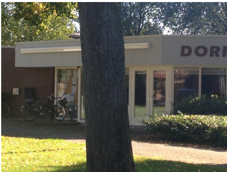
Coffee clutch in dorps huis van Tricht (500 inwoners)